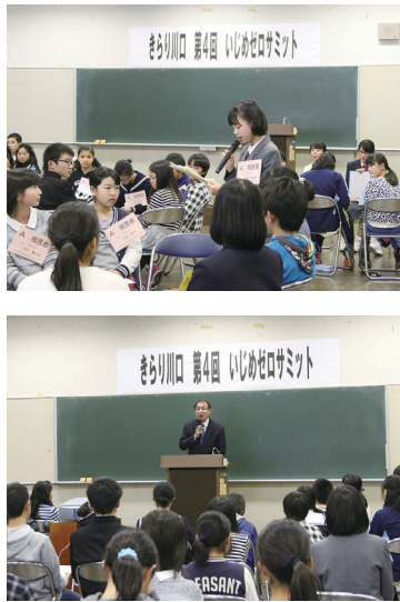
きらり川口 第4回 いじめゼロサミット