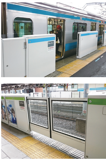
京浜東北線・山手線 ホームドア

従前より、ホームにおける列車との接触や線路への転落事故を防止する対策の必要性を要望してまいりましたが、平成29年度から、本市と埼玉県が連携し、JR東日本に対して、川口駅、西川口駅のホームドアの整備費用への補助を行い、事業を推進していくことになりました。