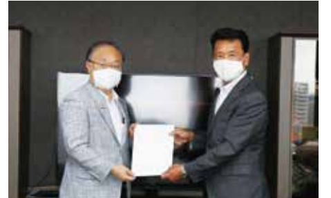
令和2年9月7日 第2波の感染拡大を受け、追加の緊急要望書を奥ノ木信夫川口市長に提出