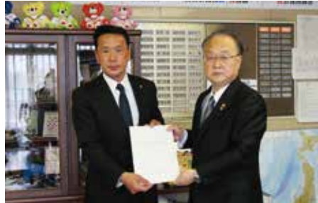
令和2年4月15日 奥ノ木信夫川口市長へ要望書を提出

引き続き、市議会最大会派としての責任のもと、さらに魅力的な「選ばれるまち 川口」になるため、自民党市議団一丸となって市政活動に取り組んでまいります。