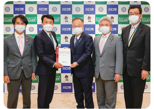
令和4年1月20日 奥ノ木市長から要望の回答を受ける

*接種を受けることは強制ではありません。厚生労働省や日本小児科学会のホームページをご覧ください。予防接種の効果と副反応のリスクの双方を充分理解していただいた上で、接種を受けるかどうかご検討ください。